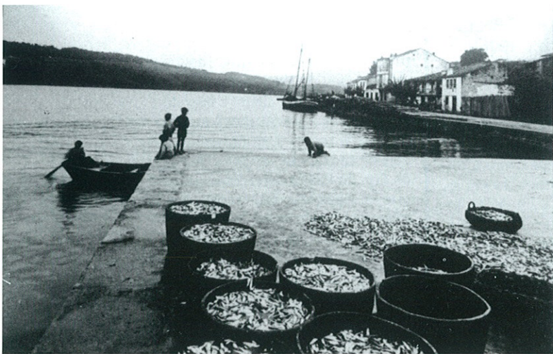
A Praza do Peixe a principios de século, coa sardiña das tarrafas

Laméntase o Presidente de que, a pesar dos enormes esforzos dos órganos de goberno do Pósito, a súa actuación non foi suficientemente valorada polos socios, e mesmo recibiron fortes críticas pola súa xestión, pasando de 168 no inicio do ano a 121 ó final. Merece unha especial atención a mordaz crítica que se fai na Memoria por mor da actitude dalgúns socios, dada a escasa participación económica destes –moitas veces nula– no financiamento dos servizos da entidade.