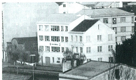
Local social da Confraría a principios dos anos 70.

Efectivamente, y sen poder evitarlo, sucedió lo que aquellos hombres sufridos temían. El fuerte oleaje arrancó las amarras de numerosas embarcaciones, lanzándolas luego una y otra vez contra los muros y el malecón del puerto. Una tras otra fueron despedazándose, convirtiéndose en astillas, sen que nada pudieran hacer por evitarlo los marineros cedeireses que, oprimidos y acongojados ante lo que estaba aconteciendo, veían como la mar demolía sen compasión, en escasos minutos,