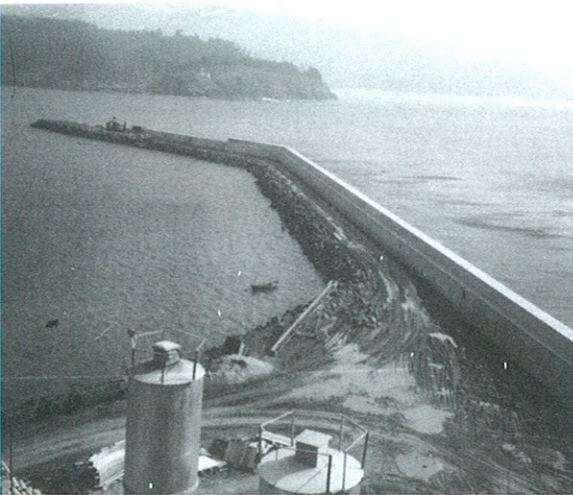
Construcción do dique. Ano 1974.

pequeno espigón no peirao vello, o que significaría o estrangulamento do futuro da flota, abocando a Cedeira a unha actividade pesqueira residual.