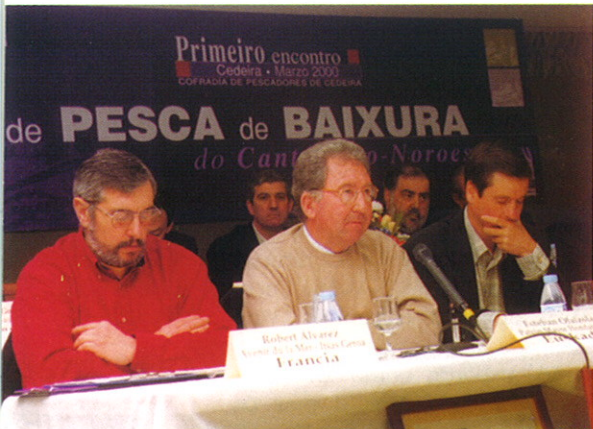
Primeiro encontro da Pesca de Baixura do Cantón do Noroeste de Galicia. Cedeira, Marzo, 2000.

No eido administrativo desenvólvense traballos de asesoramento e xestión fiscal, laboral, seguridade social e tramitacións de expedientes de prestacións por xubilación, invalidez e