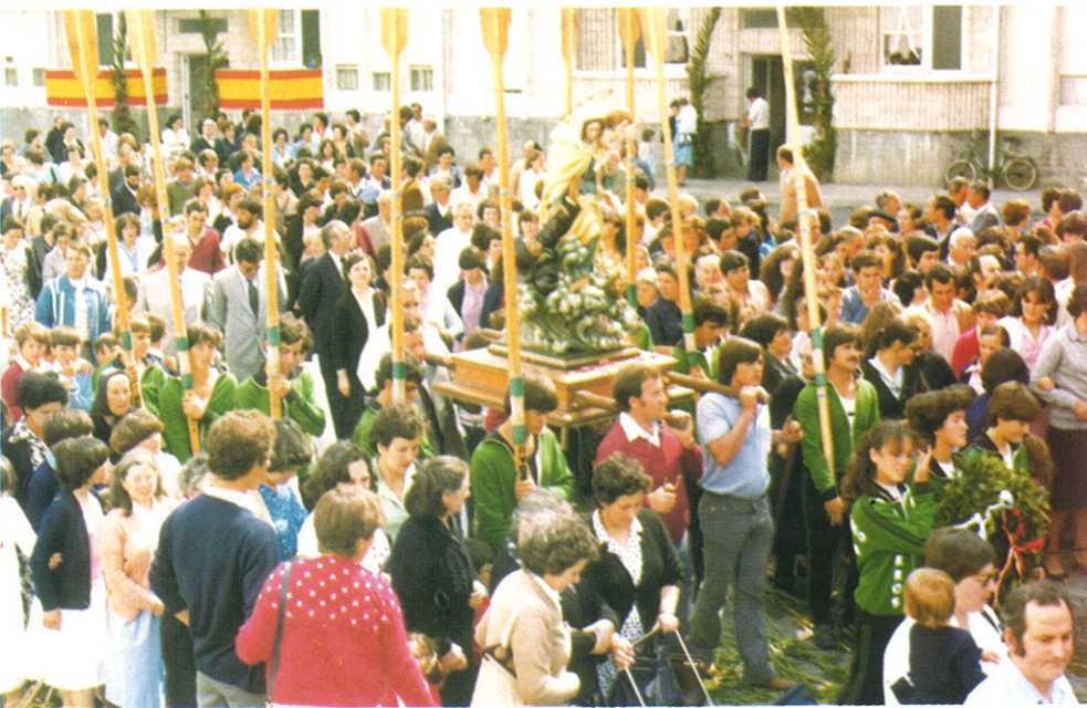
Inauguración do Grupo de vivendas Horta Nova, e traslado da imaxe da Virxe do Mar da Confraría cara a Casa do Mar.

A principios da década dos setenta retómase a vella