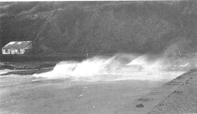
Fotografías do temporal do 67

Co fin de levar un certo control sobre a facturación por lonxa, o Cabido acorda, en 1963, facer unha relación detallada das embarcacións e cantidades cotizadas. Sen embargo, esta medida non é capaz de que na